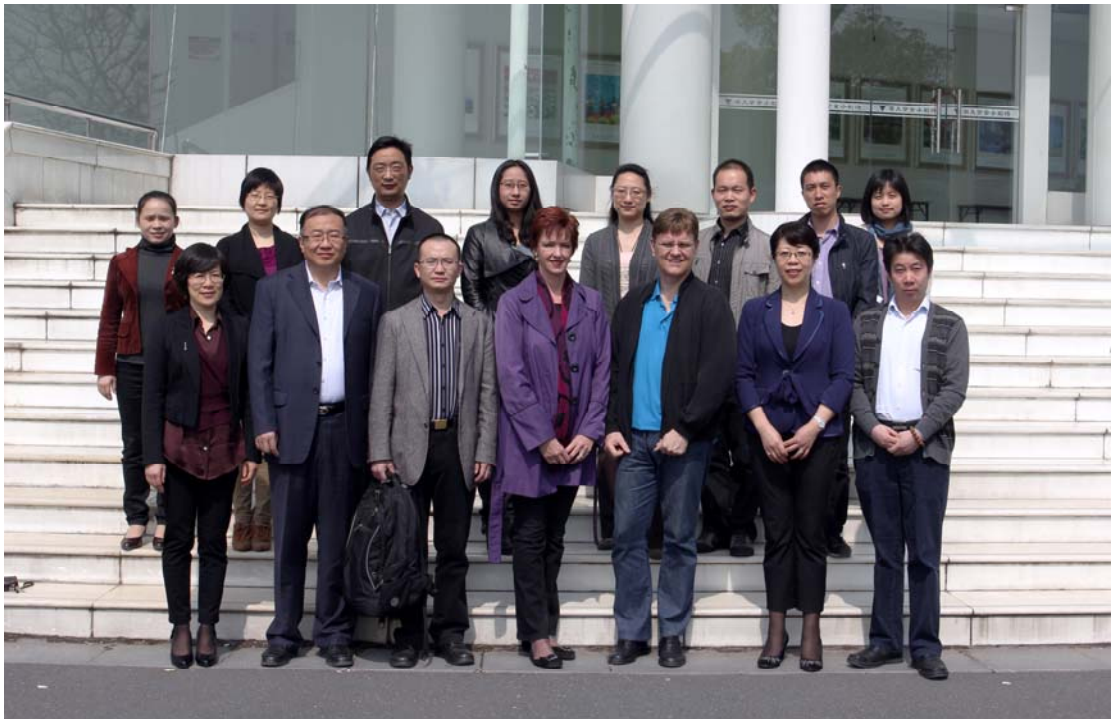
中德催眠培训班教师与中心专职人员合影

心理中心还遴选优质培训项目“精神动力学团体领导”、“聚焦取向心理治疗连续培训项目”、“中美高级精神分析连续培训项目”、“中国首届团体咨询与团体治疗工作坊”等，推荐相关专职咨询师外出学习，以不断提高专业工作水平。2012 年 4 月，第四届中德催眠培训班连续项目第一次集训在浙大心理中心举办。中心全体人员和来自全国各地的 50 多名心理咨询师参加了培训，接受了良好的专业训练。