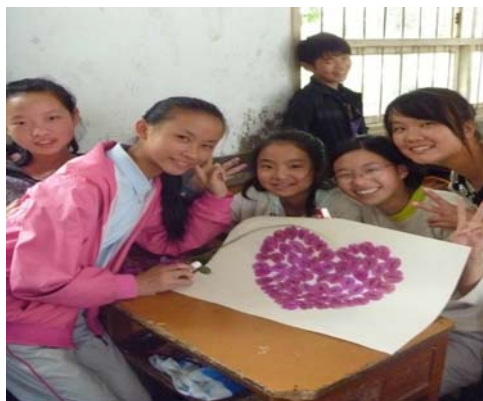
暑期社会实践活动