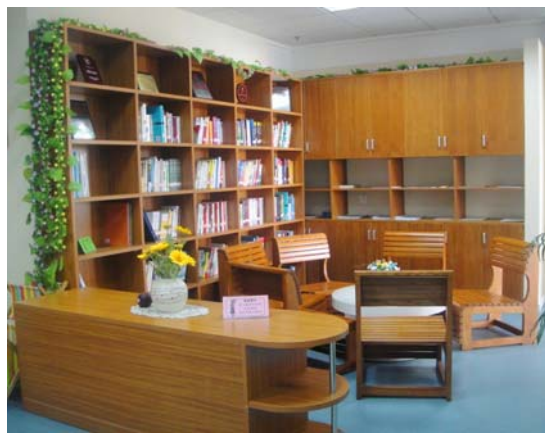
Free Talk 心理书吧